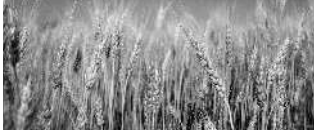
ALMA BEAUTY HAIR REMOVAL